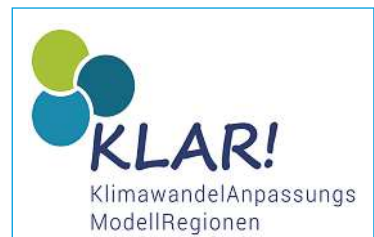
Podiumsdiskussion „Klimawandel im Pulkautal“