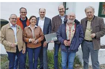
Köllamaunna & Grean: als UNESCO Kuturerbe

Wie jedes Jahr sind Dirndl & Lederhose gerne gesehen!